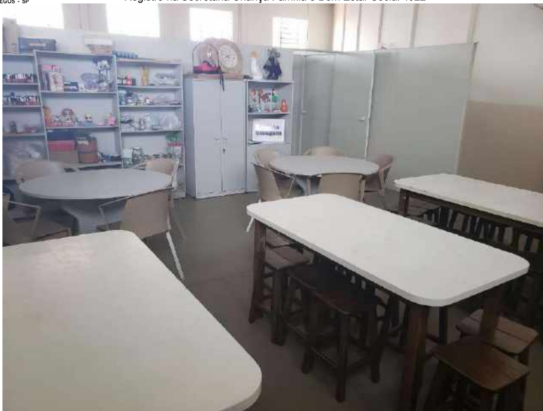
SALA DE LEITURA E JOGOS