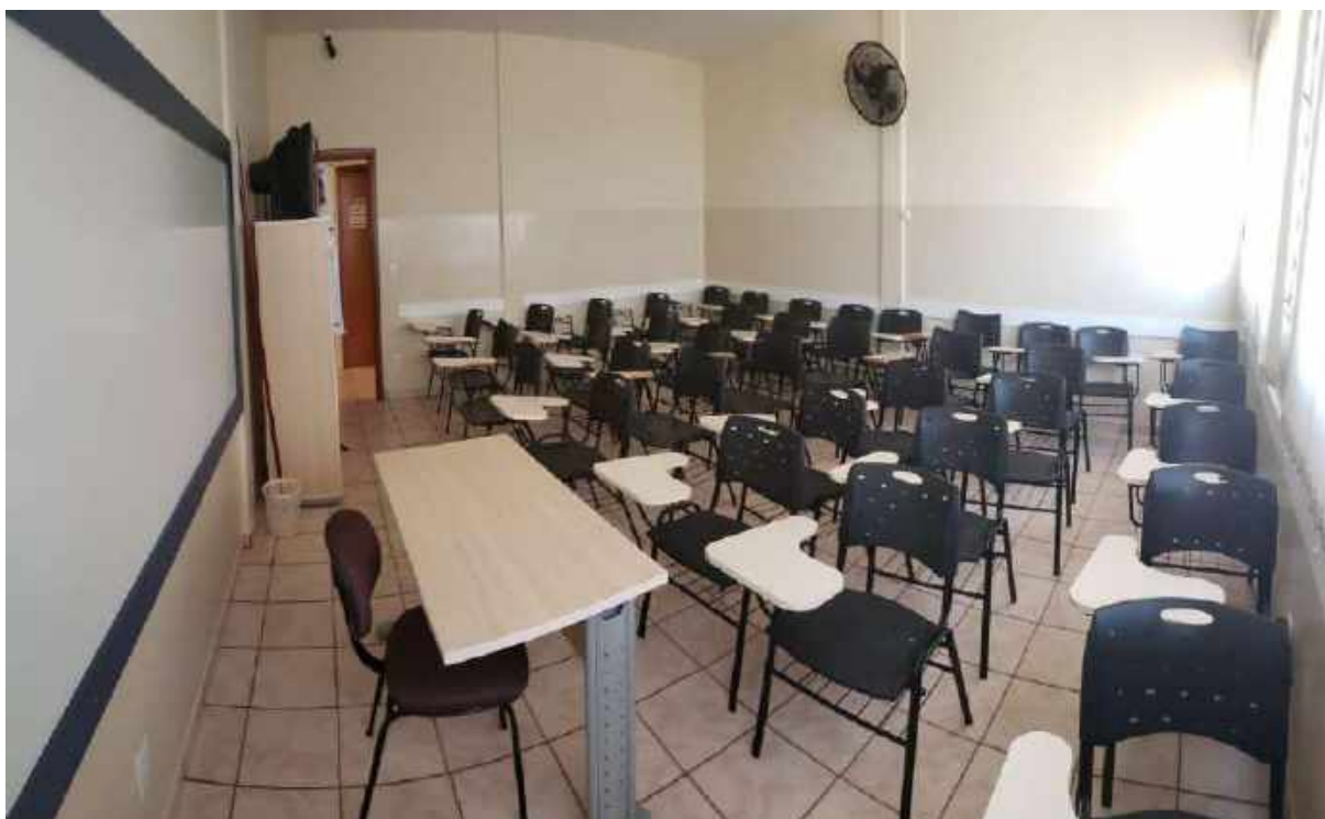
SALA DE INFORMATICA