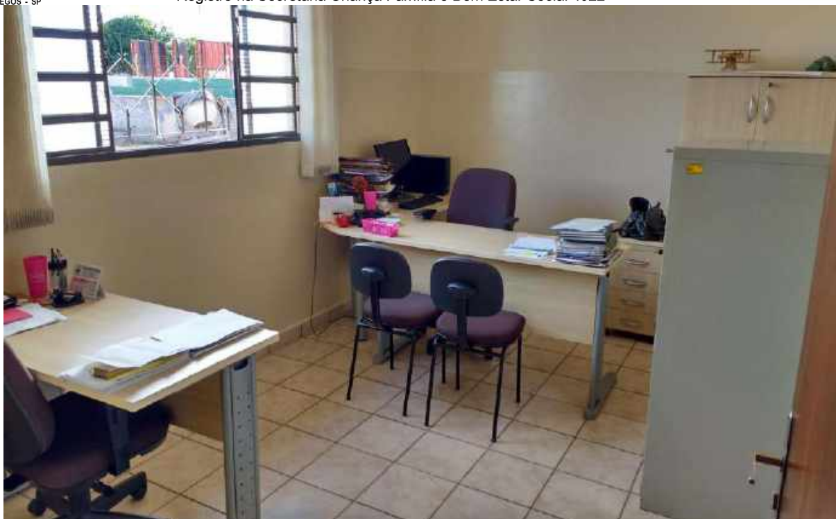
SALA DA PSICOLOGIA